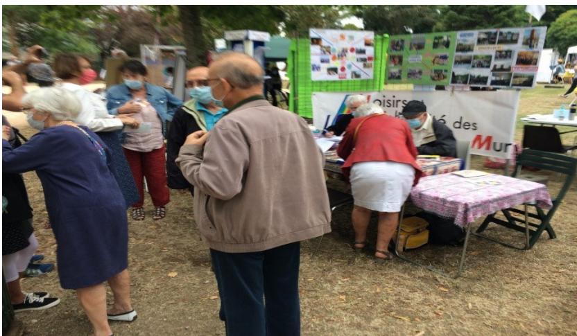
Le forum des associations, le rendez-vous incontournable de LSR.