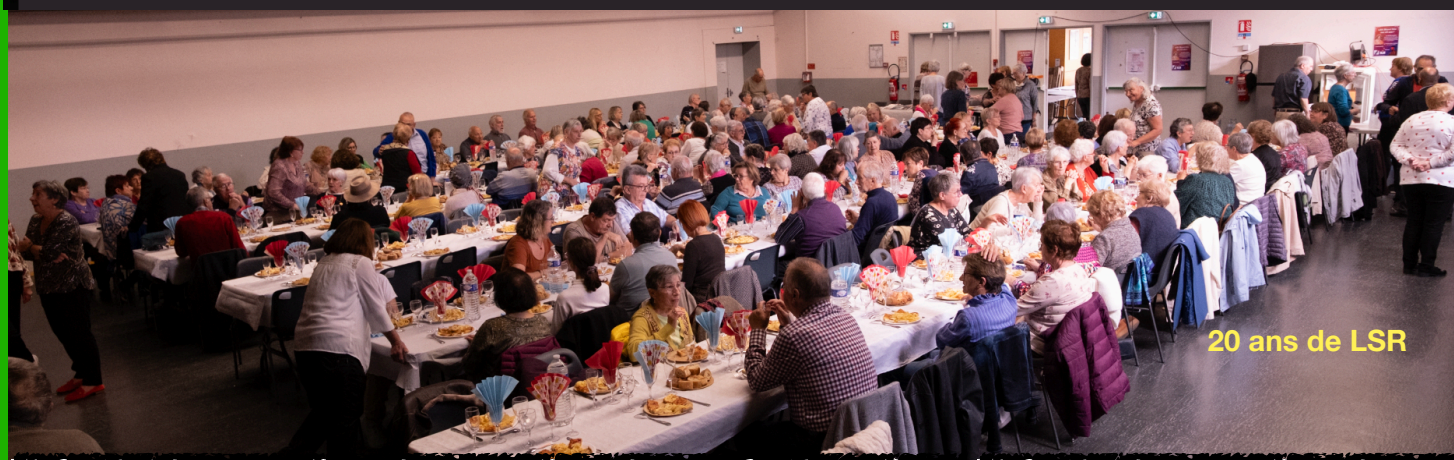
20 ans de LSR