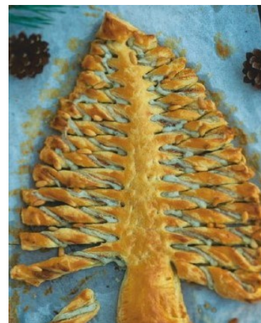
Extrait de la revue Avantages