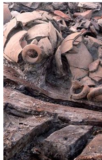
Mandirac/Castélou :chaussées d'accès à la lagune avec le bateau et les amphores (2018).